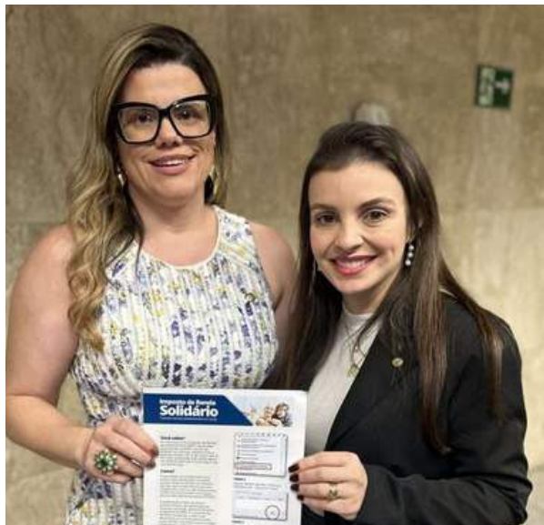
deputado federal por Goiás, Marussa Boldrin (MDB - GO)