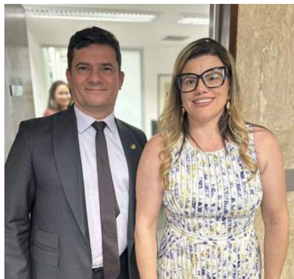
senador Sergio Moro (União-PR)