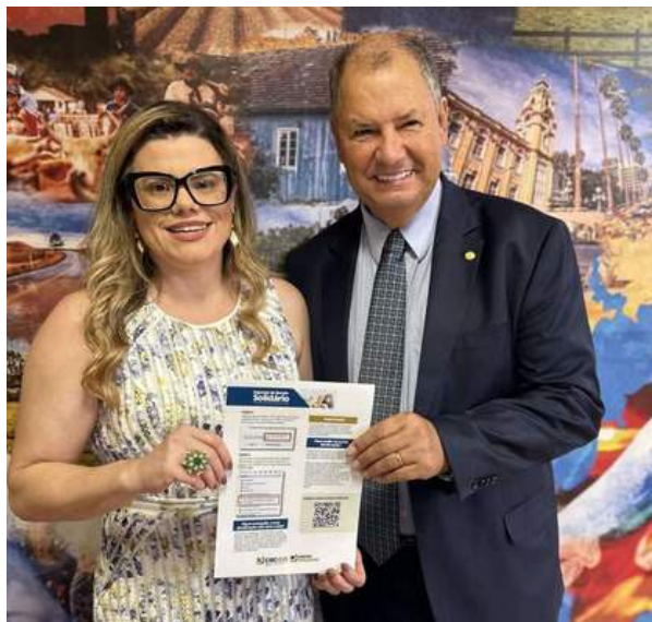
deputado federal por Rio Grande do Sul, Alceu Moreira (MDB-RS)