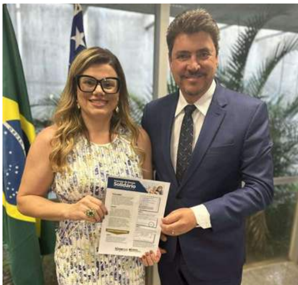
senador goiano, Wilder Morais (PL)